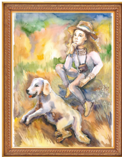
Мария Маковеева, 2 место в категории от 14 до 17 лет