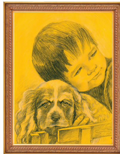
Полина Сергеева, 3 место в категории от 14 до 17 лет