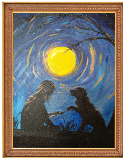
Диана Карабушкина, победитель в категории от 14 до 17 лет