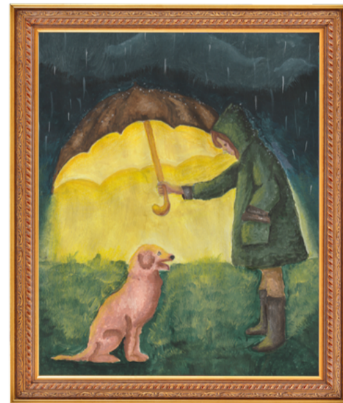
София Михайлова, победитель в категории от 7 до 13 лет