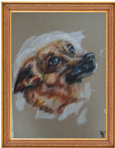
Полина Иванова, 2 место в категории от 7 до 13 лет