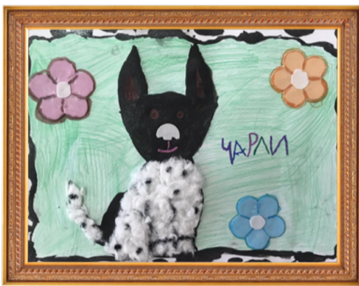
Дарья Кузнецова, 3 место в категории от 4 до 6 лет