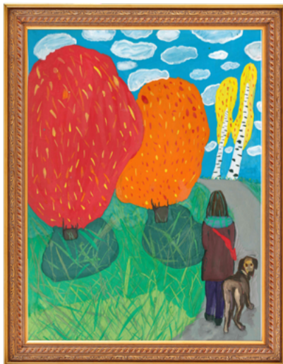
Кристина Амелина, 3 место в категории от 7 до 13 лет