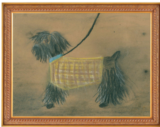
Эмилия Соколова, 2 место в категории от 4 до 6 лет